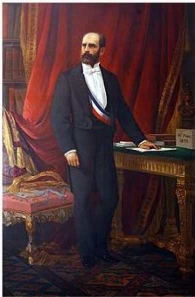
Federico Errázuriz Zañartu